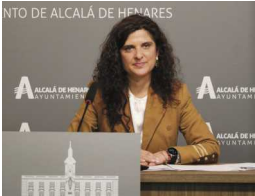
La Concejalía de Mayores lanza una completa agenda sociocultural para el primer trimestre del año