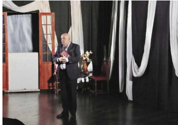
Tía estrena el año representando "Lo invisible" de Azorín el 25 de enero