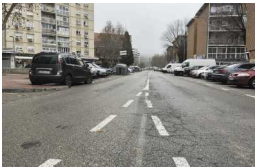
El Ayuntamiento de Alcalá invierte 400.000 euros en la mejora de las redes de saneamiento y abastecimiento