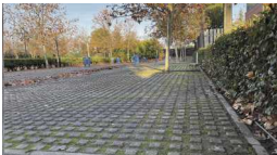
El Ayuntamiento de Alcalá acomete la mejora de la pavimentación del aparcamiento de la Junta Municipal del Distrito IV