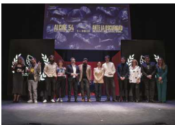
ALCINE 54 cierra 2025 con más de 35.000 espectadores y un 8% de aumento en salas