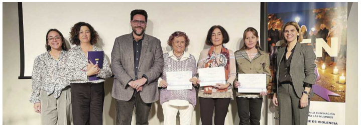
El Ayuntamiento entregó los premios del I Certamen de Poesía contra la Violencia hacia las Mujeres 'Francisca de Pedraza'